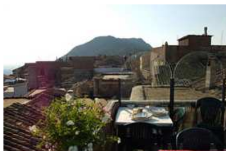
La sagoma del Monte Soratte vista dalla terrazza