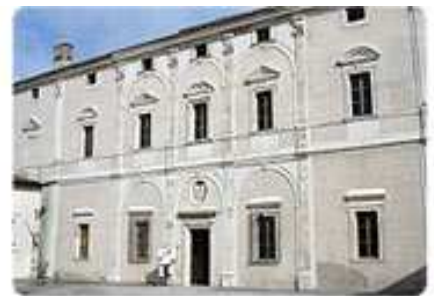
Il rinascimentale Palazzo Caccia-Canali

Il pomeriggio sarà impreziosito da una visita al centro storico di Sant'Oreste, che conserva ancora pressoché intatto il suo impianto medioevale. Vi si accede attraverso le tre porte, che assunsero un aspetto monumentale nel 1554, quando fu rinforzata la struttura difensiva con i bastioni. Tra gli edifici civili più interessanti si distinguono il palazzo Caccia-Canali, inaugurato nel 1589 nell'omonima piazza, ed il palazzo Rosati in Piazza Carlo Alberto. La chiesa di San Biagio fu parrocchia fino al 1570, mentre quella di San Nicola fu uno dei primi centri della vita monastica femminile (già dal 1300 lì accanto sorgeva il monastero delle monache di clausura, menzionato anche in una bolla di papa Gregorio XIII del 1573). Il monastero di Santa Croce fu la prima sede della comunità intesa come centro amministrativo e burocratico: fu lì che, nel 1576, venne emanato lo Statuto di Sant'Oreste. Il giro verrà ultimato recandoci al Palazzo Caccia-Canali, magnifico esempio di architettura vignolesca.