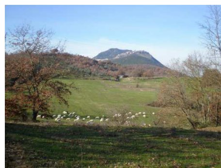
Il Monte Soratte ed il paese di Sant'Oreste