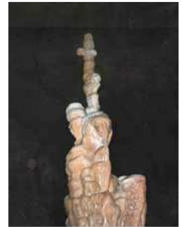
Spettacolare concrezione carsica