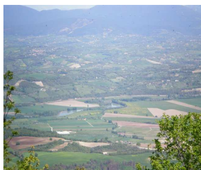
La valle del Tevere vista dal Monte Soratte