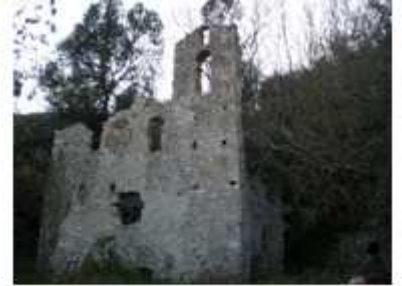
L'eremo di Santa Romana, nei pressi dei "Meri"

Descrizione: Il Monte Soratte , in virtù della sua composizione geomorfologica, presenta un numero impressionante di cavità naturali, originatesi nel corso dei secoli grazie all'azione erosiva delle acque meteoriche: questi affascinanti e splendidi fenomeni carsici , ricchi di concrezioni, conferiscono un valore inestimabile all'area protetta. E' possibile organizzare una visita guidata tematica per osservare da vicino, con le opportune cautele, gli imbocchi di alcune di queste grotte: la Grotta di Santa Lucia , che con i suoi 300.000 mc di volume può vantare la più grande camera ipogea del Lazio; i Meri , le tre impressionanti voragini verticali conosciute già dai tempi di Plinio il Vecchio , secondo il quale costituivano le vie di accesso al Regno degli Inferi ; la magnifica chiesa rupestre di Santa Romana , costruita all'interno di una spelonca dove, ancora oggi, una vasca marmorea raccoglie lo stillicidio dell'acqua che modella delle piccole concrezioni. Questi ambienti, che custodiscono delle rare colonie di chiroteri e che fanno del Monte Soratte un Sito di Importanza Comunitaria (S.I.C.), sono caratterizzate da ecosistemi molto delicati: noi proveremo ad approfondire, attraverso un itinerario ad anello, alcuni aspetti peculiari di questo mondo misterioso che ha sempre suscitato curiosità nell'uomo. Tornati in paese, si raggiungerà il ristorante per il pranzo in soli 5 min.