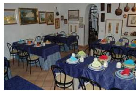
Tavoli imbanditi e arredamento