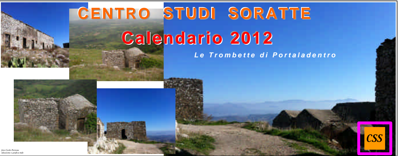
Illustrazione e grafica nido